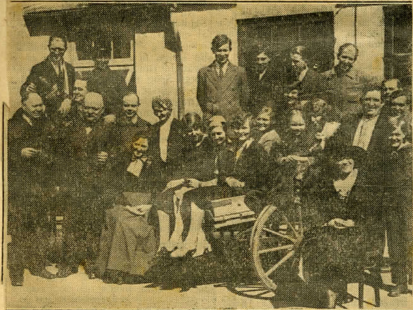
Alle de Medvirkende, saavel Skuespillere, Instruktør, Forfattere, Dekorationsmaler, Regissør som Sufflør og Musikere m. fl. ved „Jubilæumsrevuen“ i Dragør.